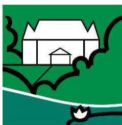
JONCHÈRE MALMAISON SAINT-CUCUFA